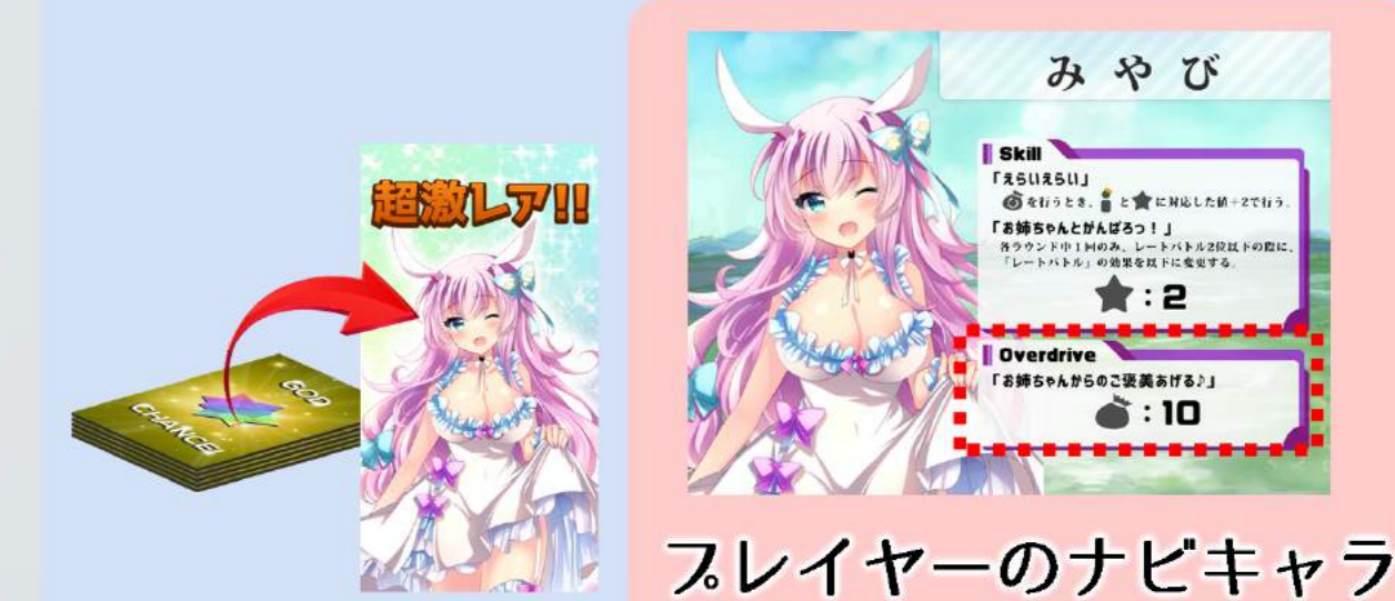
スレイヤーのナビキャラ

「ナビキャラカード」が「みやび」であるスレイヤーが「God Chance」を行って、「みやび」を引いた。このとき「Overdrive」"お姉ちゃんからのご褒美あげる♪"が発動し、ただちに●：10の効果によってガチャを10個引く。