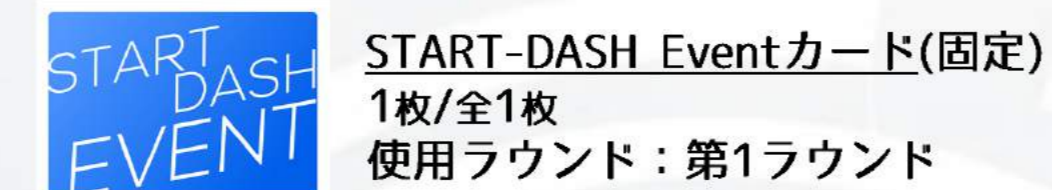
START-DASH Eventカード(固定) 1枚/全1枚 使用ラウンド：第1ラウンド

各イベントカードを裏向きのまま選んでゲームボードの近くに置いておきます。選ぶ枚数はイベントカードの種類によって決まっており、選ばれなかったイベントカードは使用しませんので、箱に戻します。