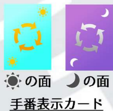
●の面 ●の面 手順表示カード

一番最近ガチャを引いた人がスタートスレイヤーになります。そうでなければサイコロを振って一番高い目を出したスレイヤーがスタートスレイヤーになります。スタートスレイヤーの前に手順表示カードを●の面を表に向けて配置します。