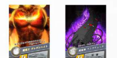
山札を混ぜる際に よけるボスカード