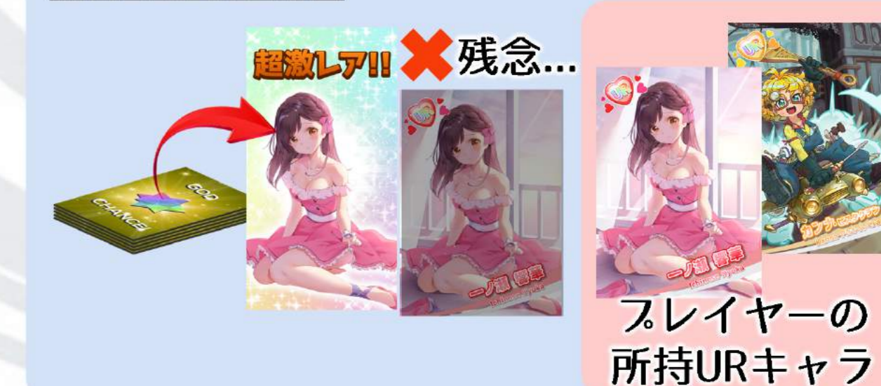
スレイヤーの所持URキャラ