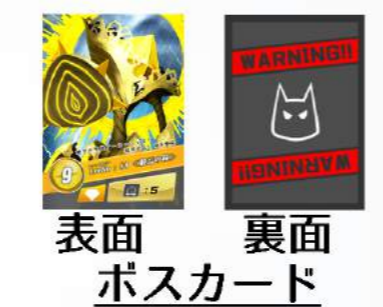
表面 裏面 ボスカード

レイドボス山札の一番上のカードを引き、表にしてボード上の▲の描かれた場所に置きます。置かれたレイドボスの体力と同じ数字の♥マスに、●を置きます。