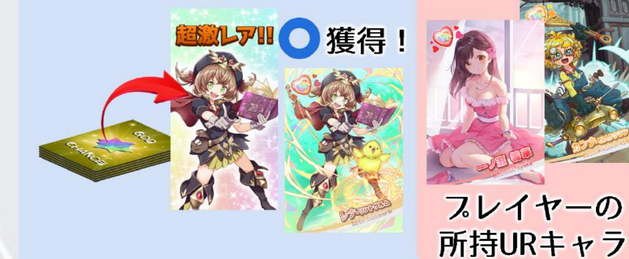
スレイヤーの所持URキャラ