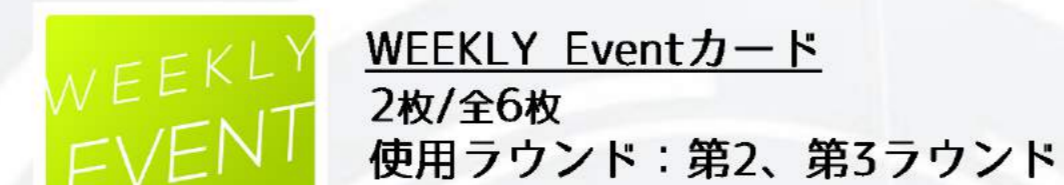
WEEKLY Eventカード 2枚/全6枚 使用ラウンド：第2、第3ラウンド